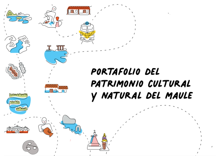
Figura 1. Portada Portafolio del Patrimonio Cultural y Natural del Maule. Fuente: Gobierno Regional del Maule. Portafolio del Patrimonio Cultural y Natural del Maule. 2021.