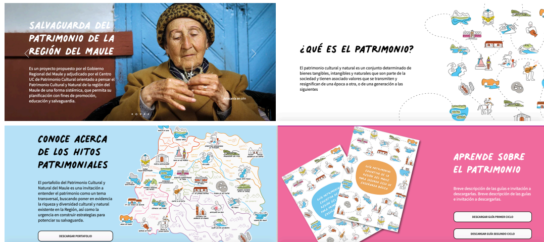
Figura 4. Sitio web patrimonio cultural y natural del Maule.