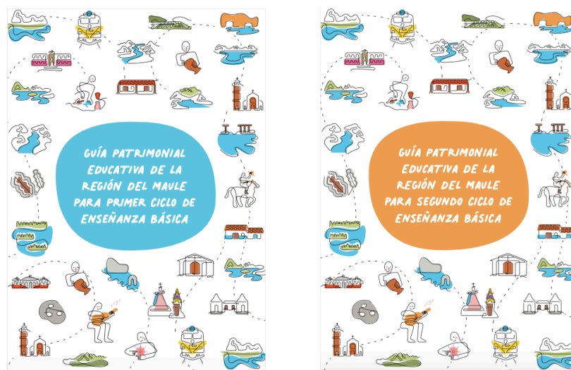
Figura 2. Portadas de las Guías patrimoniales educativas de la Región del Maule.